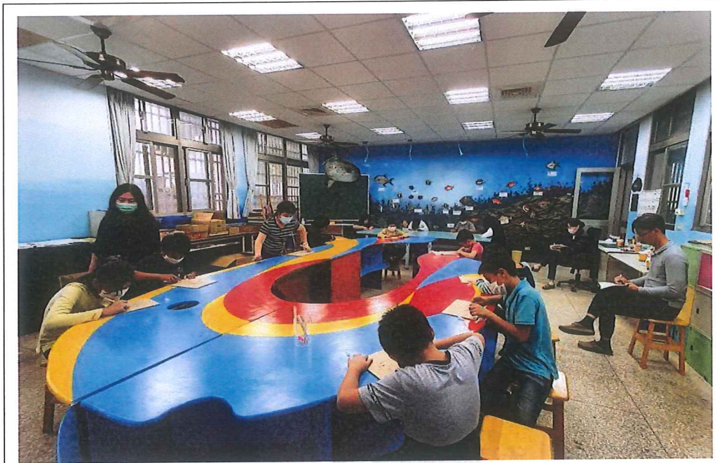
活動：公開授課 日期：109. 3. 23