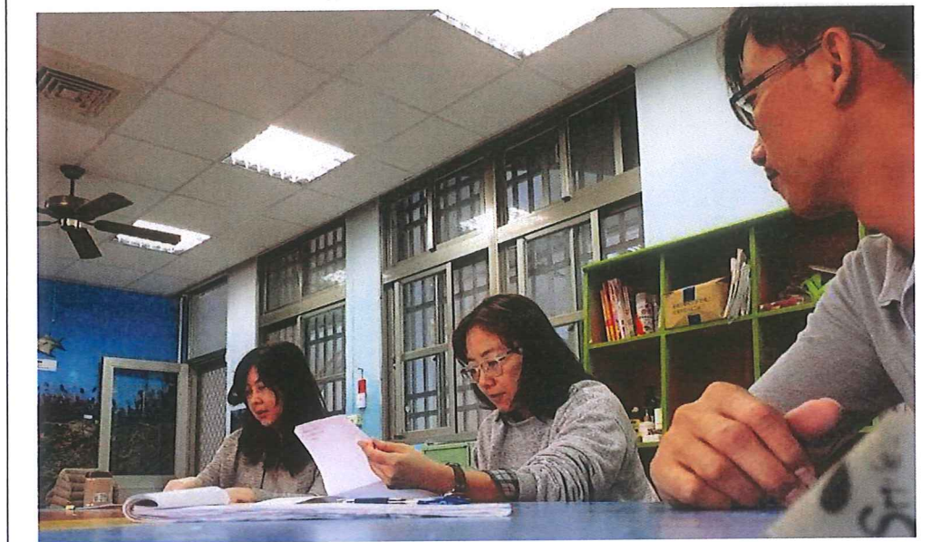
活動：議課及回饋 日期：109. 3. 30