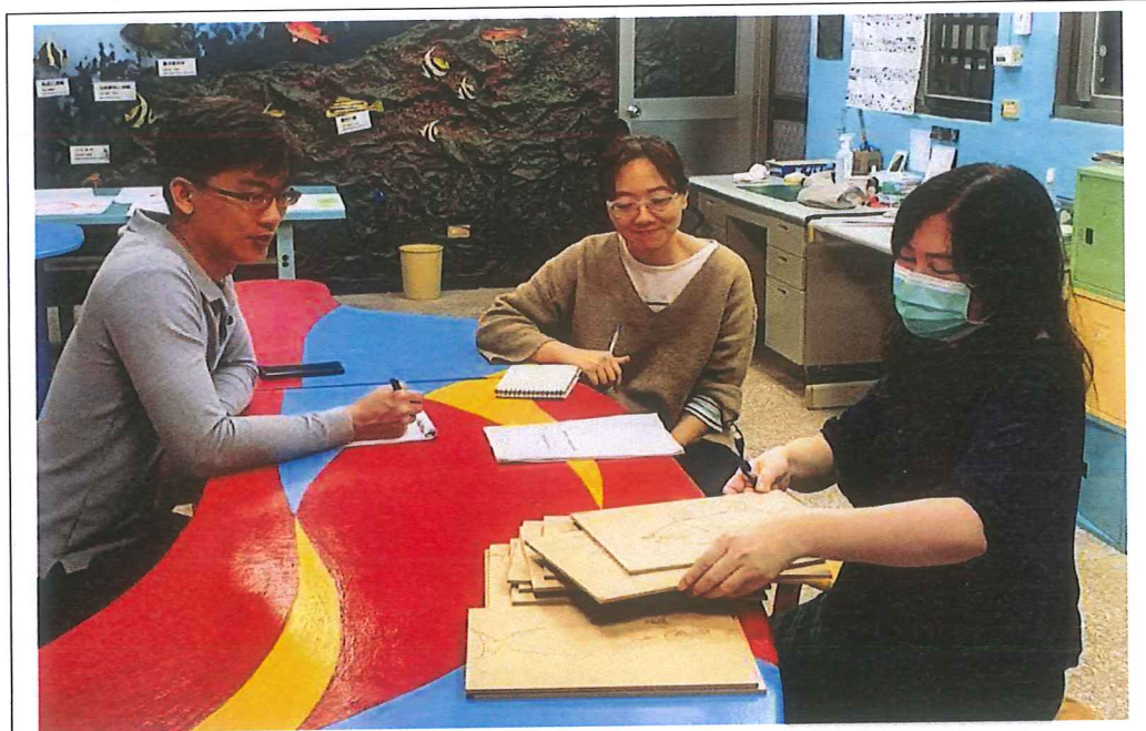
活動：說課及共備 日期：109. 3. 23